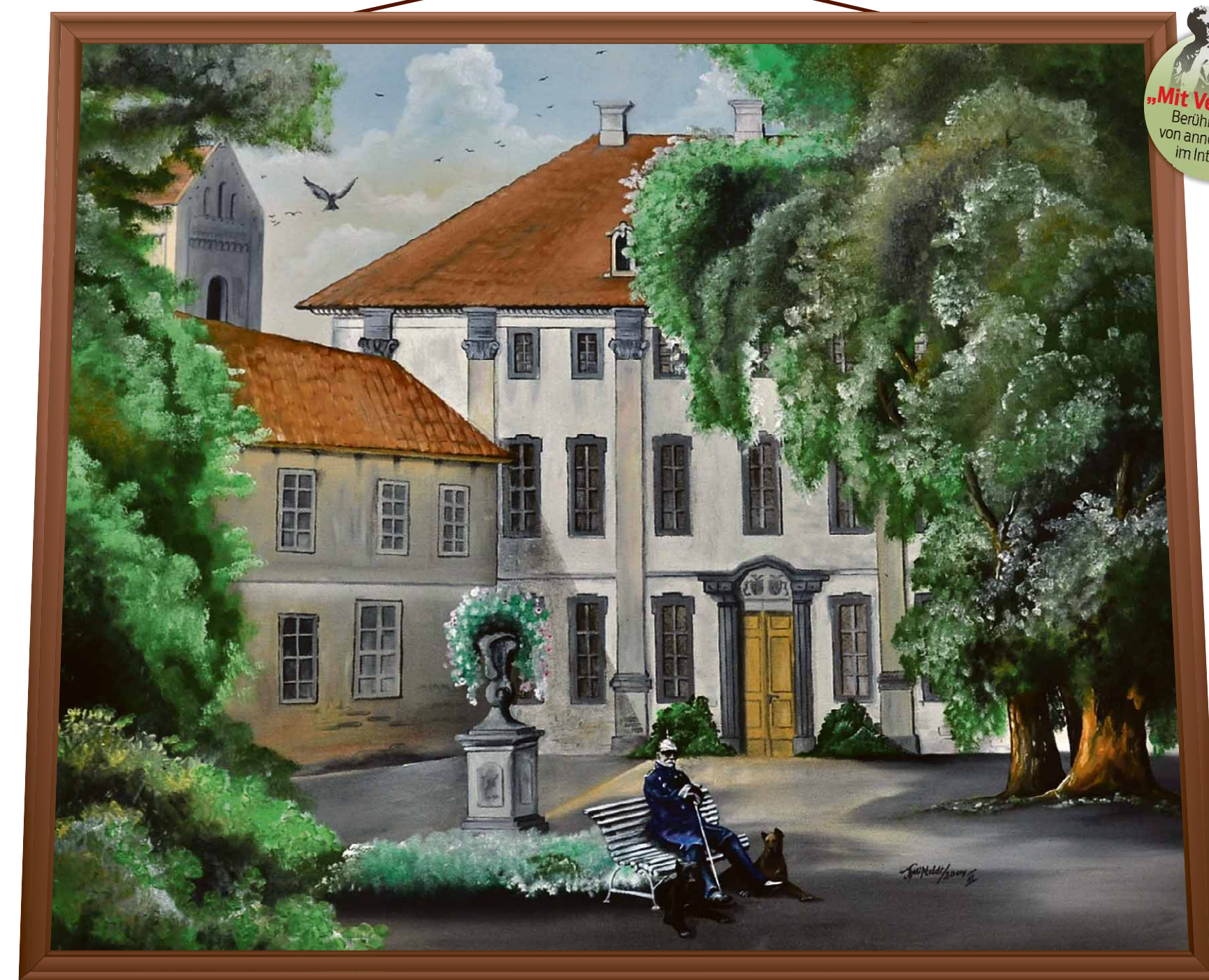
Dieses Bild hat Thomas Mißfeld gemalt. Es hängt im Versammlungsraum im Rathaus. Zu sehen ist Otto von Bismarck mit seinen beiden Hunden auf einer Bank vor dem Schloss in Schönhausen, das Ende der 1950er Jahre zu großen Teilen gesprengt worden ist.

Leben ist nicht ganz das richtige Wort für das in der Tat sehr zurückgezogene Dasein, das ich hier derzeit führe. Allerdings verleiht einem der derzeitige Zustand eine etwas unheimliche Allgegenwart, durch die ich auch das Gedeihen meines Geburtsortes durchaus gewahr geworden bin. Ich habe mich gefreut, dass der damalige Bürgermeister, dessen Name mir leider gerade kürzlich – jedenfalls für meine Verhältnisse kürzlich – entfallen ist, dieses Museum eingerichtet hat. Dadurch werden die Menschen daran erinnert, dass es mich gegeben hat. Einen wirklichen Besuch fasse ich aber dennoch nicht ins Auge. Ich fürchte, ich würde die Leute nur erschrecken. Sie können aber sicher sein, dass ich nicht ohne Mitgefühl geblieben bin, als 2013 große Teile des Ortes und der barocke Park in den Fluten der Elbe versanken. Umso mehr freue ich mich, dass sich gerade dieses Gartenkunstwerk zu neuem Leben erhebt und auch die Sandsteinfiguren in den Genuss einer Erneuerung gekommen sind.